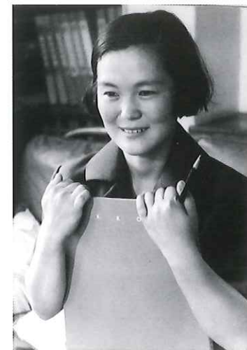
スケッチブックを持つちひろ1960

中央大学法学部政治学科卒業、前進座附属養成所(12期)を修了後、1989年入座。静岡県出身。乙川優三郎原作『あなまどい』喜代、ジェームス三木作・演出『薄桜記』千春、山本周五郎原作『柳橋物語』おもんなど数多く主演を務める。『松本清張朗読劇シリーズ』では松本清張記念館での公演に16年連続で出演。多彩な声を使い分けたその演技は他の追随を許さない。