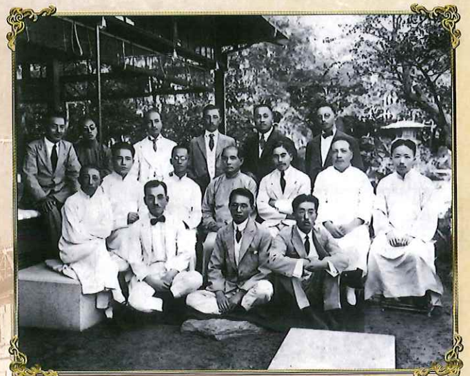
1922年9月、上海での太田宇之助(前列中央)・孫文の記念写真。